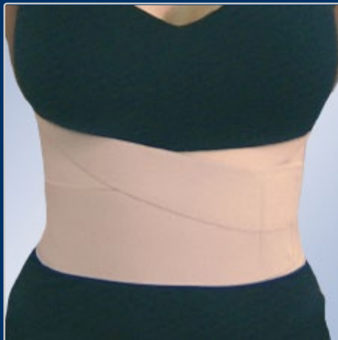
Ref.: BE-165 HOMBRE